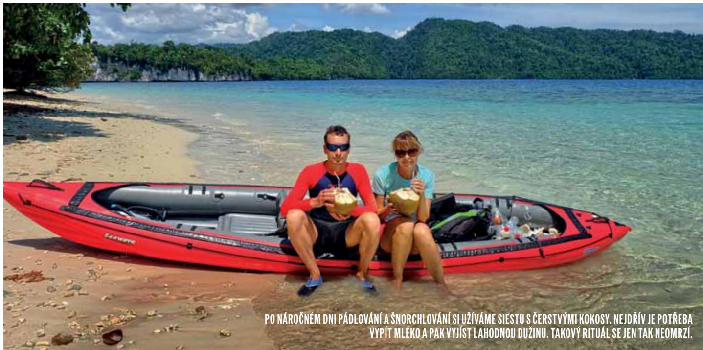
PO NÁROČNÉM DNI PÁDLOVÁNÍ A ŠNORCHLOVÁNÍ SI UŽÍVÁME SIESTU S ČERSTVÝMI KOKOSY. NEJDŘÍV JE POTŘEBA VYPÍT MLÉKO A PAK VYJÍST LAHODNOU DUŽINU. TAKOVÝ RITUÁL SE JEN TAK NEOMRZÍ.

a mušlemi. Neskutečné! Připadáme si jako Robinsoni. Jsme překvapeni, že tu nejsou silné proudy. Alespoň dnes jsme žádné nezaznamenali. Po návratu se dozvídáme, že se stan našel. Máme radost! Taxikář ho vrátil do hotelu a po dvou dnech nám ho skutečně přivezou. Místní jsou velmi vstřícní.